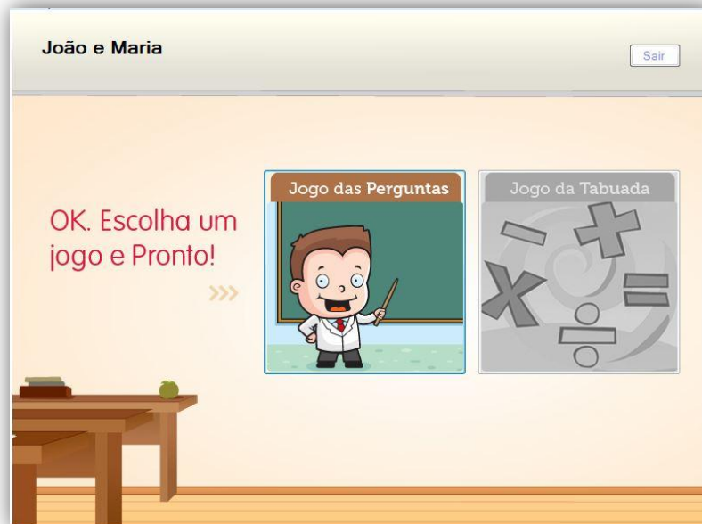
Figura 13: Tela de Escolha do Jogo

A Figura 13 apresenta os dois jogos do sistema, porém, só estará habilitado o jogo que o professor tiver inicializado.