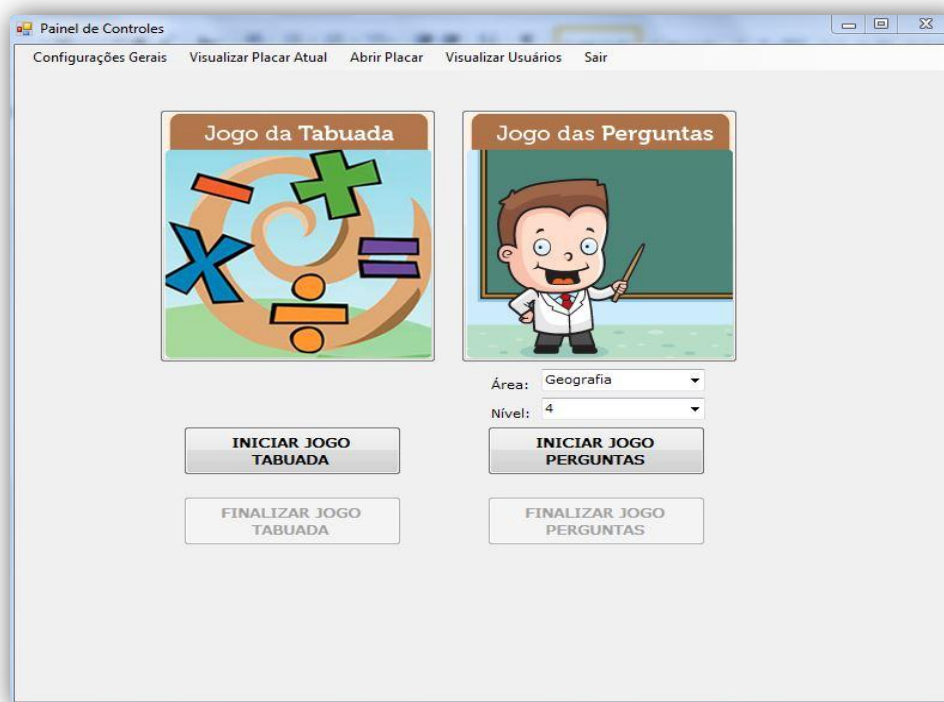
Figura 5: Tela Principal (Acesso ao Sistema do Professor)