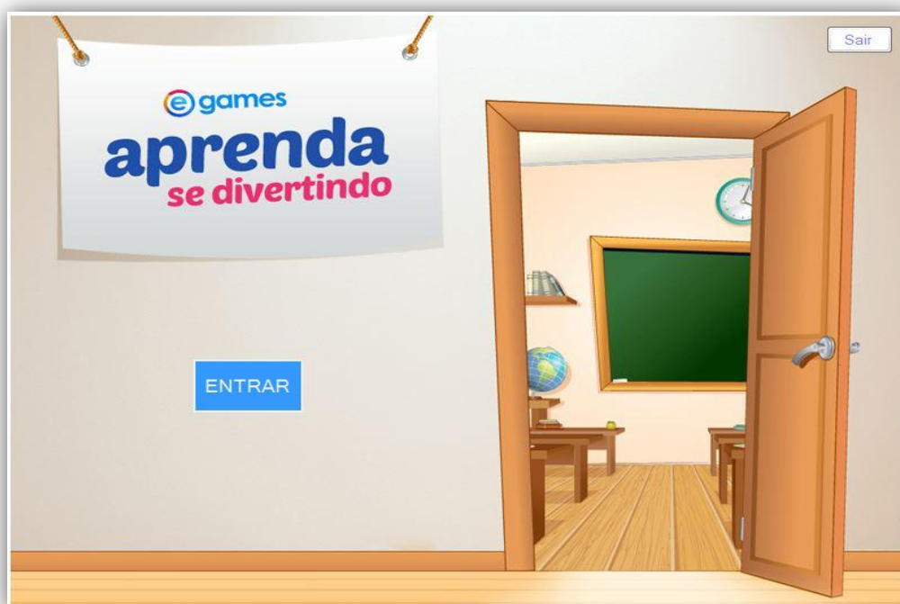
Figura 11: Tela Principal (Acesso do Aluno)

Ao entrar no sistema o aluno irá visualizar a tela inicial do jogo, apresentada na Figura 11.