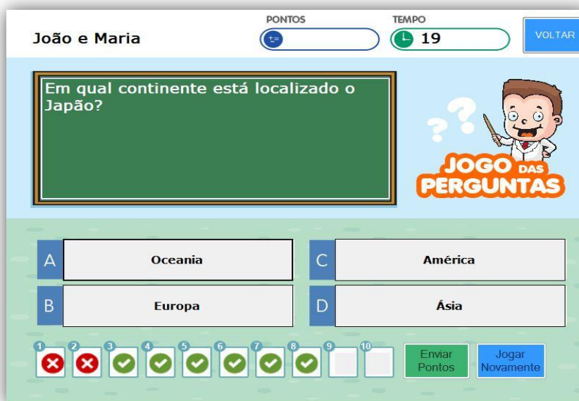
Figura 15: Jogo de Perguntas e Respostas

No jogo de perguntas e respostas, o aluno irá encontrar questões da área e do nível habilitados pelo professor. Serão apresentadas 4 alternativas de resposta e o aluno pode escolher uma entre elas.